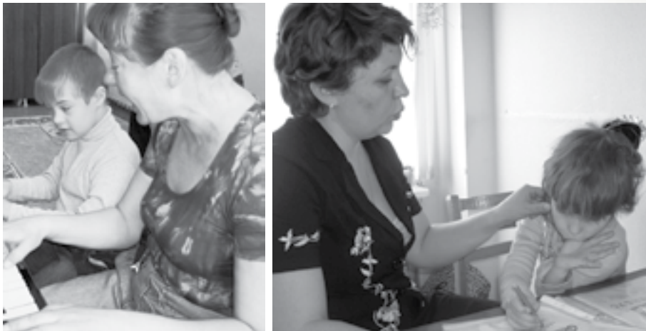
(Центр А.И. Бороздина как духовное движение)