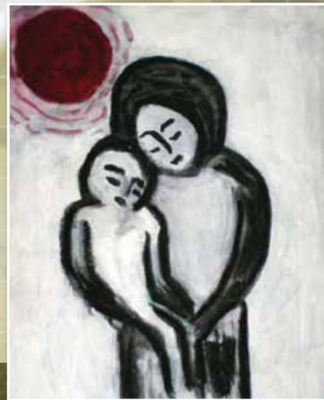
Мать и сын